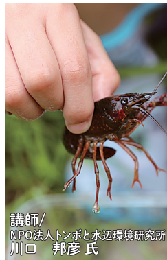
講師/ NPO法人トンボと水辺環境研究所 川口 邦彦氏